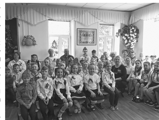
Фото Некрасовской начальной школы

Школьники читали стихи, танцевали, пели. Кульминацией праздника стало исполнение песен «Катюша» и «День Победы».