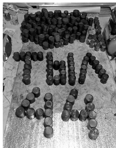
весны - 8 Марта. А сами, наверное, будут работать, делать все для фронта и для Победы.

Услышат эти милые женщины самые теплые слова поздравлений, благодарности и в предстоящий первый праздник