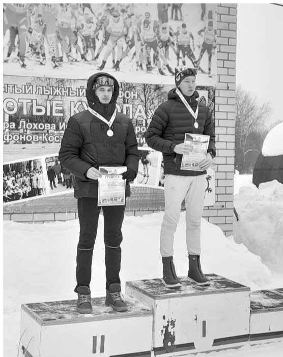
Фото предоставила Ольга ПОТАПОВА , директор спортивного центра имени А.И. Шелюхина

Среди юниоров 2006-2007 годов рождения на дистанции 50 километров Савелий Финогонов занял первое место, а в абсолютном зачете среди всех участников стал седьмым.