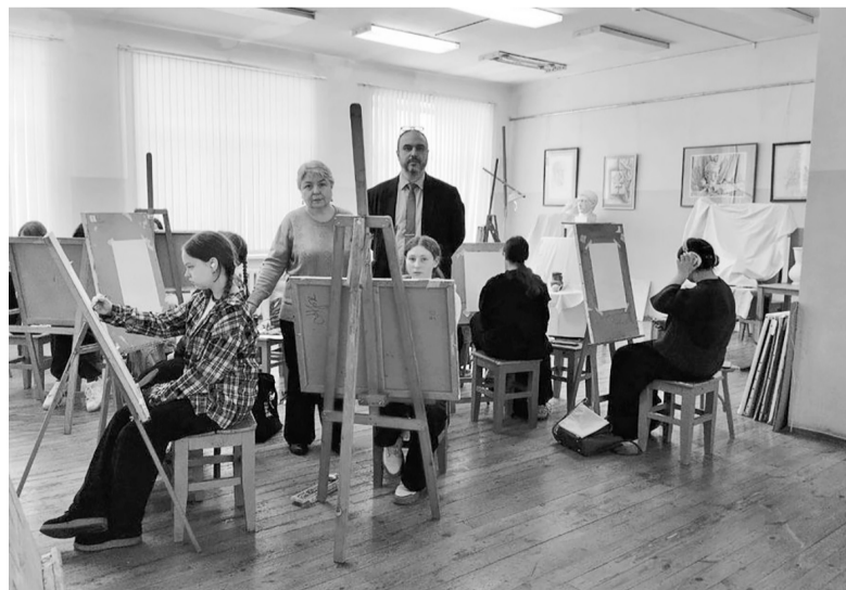
Фото и текст с сайта КГСХА

После олимпиады состоялась профориентационная беседа с ребятами и учителями. Школьников вместе с родителями пригласили в академию на День открытых дверей, который состоится 21 марта.