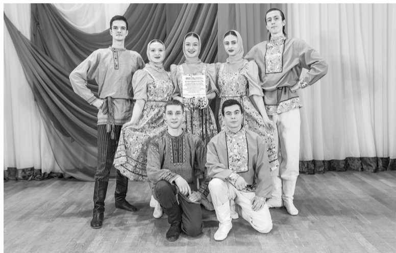
Фото центра культуры и молодежи «Перспектива» Костромского района

В праздничном концерте звучали песни, были показаны танцы в исполнении артистов разных национальностей. На сцене выступили не только те, кто постоянно проживает на территории нашей страны, но и те, кто искренне любит Россию и считает ее своим родным домом. Каждая культура подарила зрителям частичку своей души, создавая удивительную гармонию.