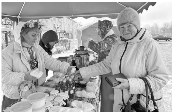
продукты к празднику в среднем на 30% дешевле, чем в магазинах.

Пасхальные ярмарки по инициативе главы региона будут организованы второй раз. В прошлом году благодаря акции жителя смогли приобрести