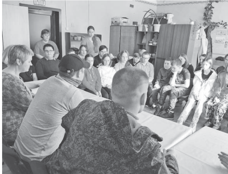
Школьники из Боговарова встретились с бойцами СВО

Добровольцы организации «Боевое Братство Галич» и РОО Содружества пограничников Ивановской области помогли в погрузке и доставке гуманитарной помощи. «Братство» на своей страничке ВКонтакте подробно описало все превратности пути. Но главное - помощь землякам в зону СВО доставлена. Вот что они пишут: «... в очередной раз услышали, что снабжение хорошее, но вот письма от детей, гостинцы, которые они собирают, и, конечно, домашние заготовки греют душу бойцам, в целом отгружено всем много. Галич и Шарья собирают большой груз, и сбору по логистике можно позавидовать, в этом они сплотились, молодцы!». ZoV - Галич сообщает, что еще три маскировочные сети поехали в 153-й танковый батальон, гаубичный дивизион.