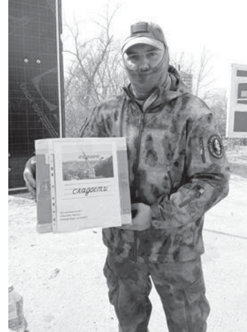
Помощь из Галича доставлена