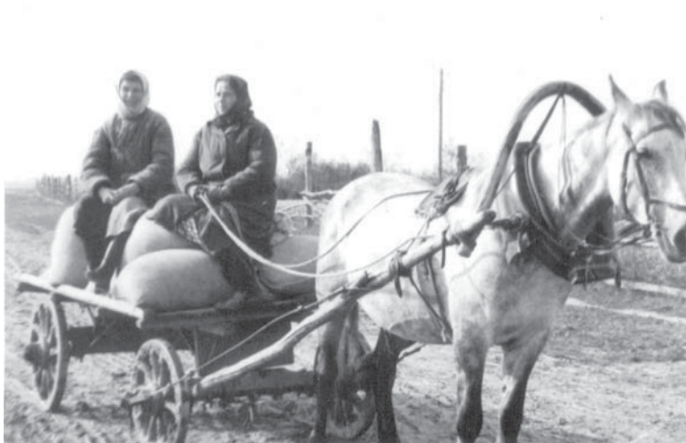
ще. Была направлена в город Мологу Ярославской области