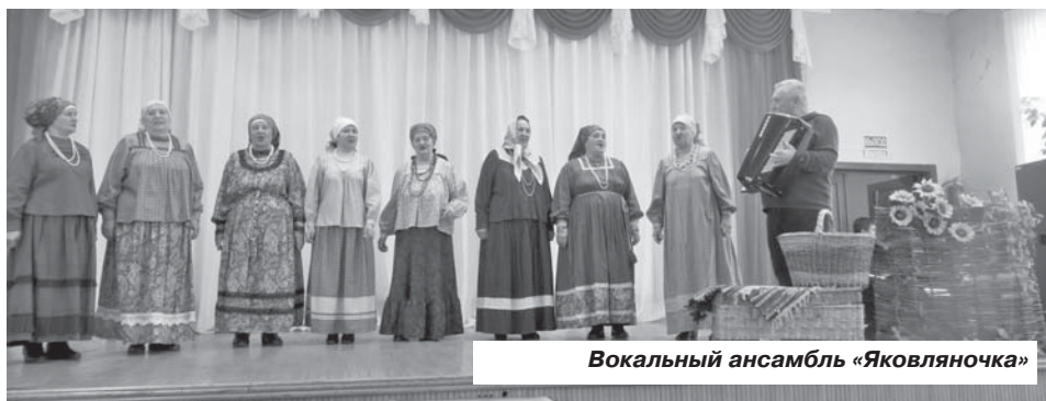
Вокальный ансамбль «Яковляночка»