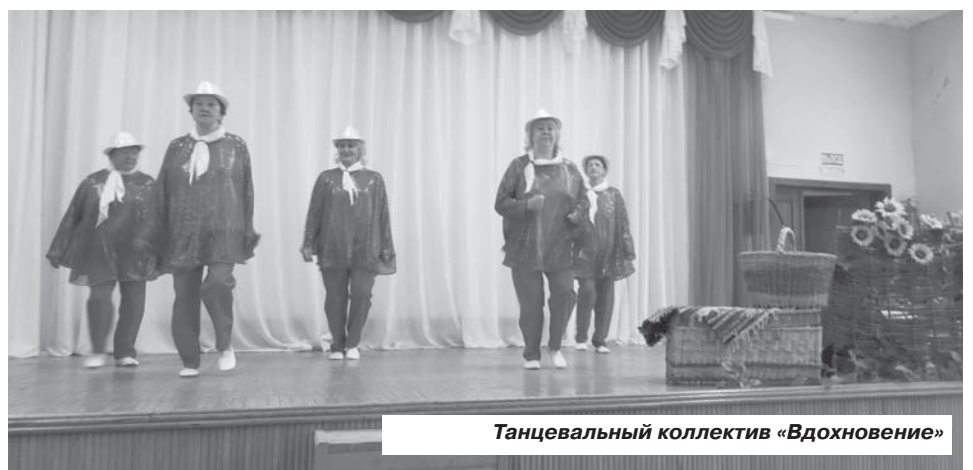
Танцевальный коллектив «Вдохновение»