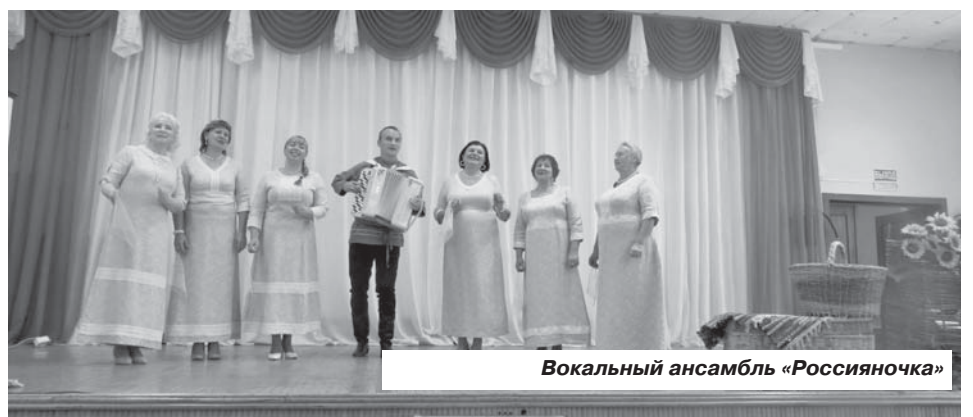
Вокальный ансамбль «Россияночка»