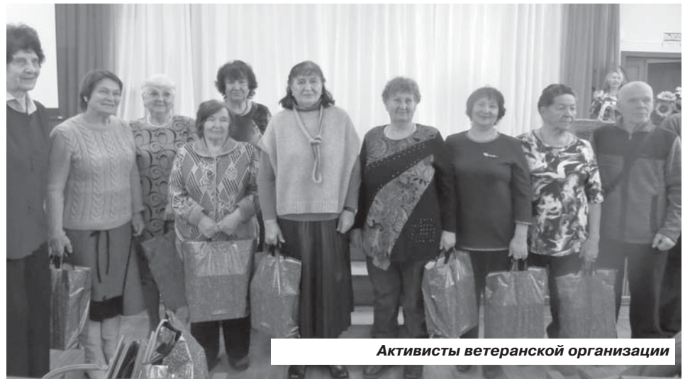
Активисты ветеранской организации

- Благодарю всех, кто в этом году принял участие в конкурсах. Желаю крепкого здоровья, успехов, новых богатых урожаев. Спасибо нашим артистам за умение создавать хорошее настроение.