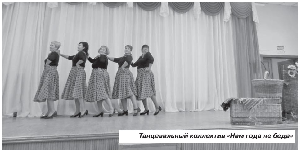
Танцевальный коллектив «Нам года не беда»