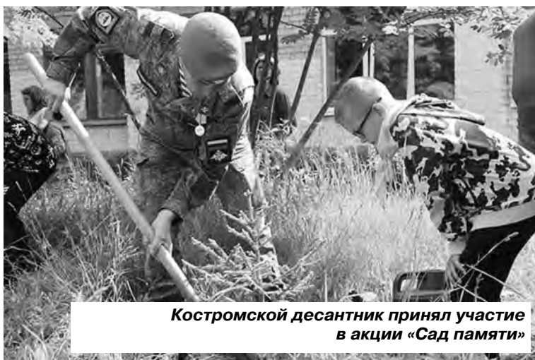
Костромской десантник принял участие в акции «Сад памяти»

координировать действия артиллерийских групп. Отправили и приятный подарок – две гитары, подписанные артистами Родионом Газмановым и Игорем Петренко.