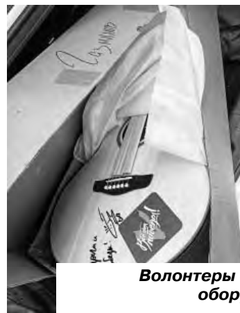
Волонтеры собрали для военнослужащих оборудование и приятные подарки

«Нам все объяснили, рассказали порядок действий. Я считаю, это очень удобно, когда в одном месте собираются разные специалисты. Не надо ходить в разные инстанции, чтобы получить помощь или поддержку. Искренне благодарю Пре-