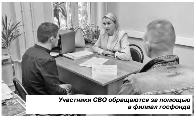
Участники СВО обращаются за помощью в филиал госфонда

Комплекты защищенных средств связи передал артиллеристам из 1065-го полка костромской благотворительный фонд «Единение». Комплекты добровольцы купили совместно с активистами местного отделения Народного фронта. Высокотехнологичное спецоборудование позволит