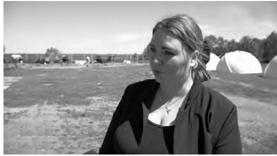
«Агротуризм» на развитие проекта сельского туризма в 2023 году.

Ранее фермер стала победителем федерального конкурса на предоставление гранта