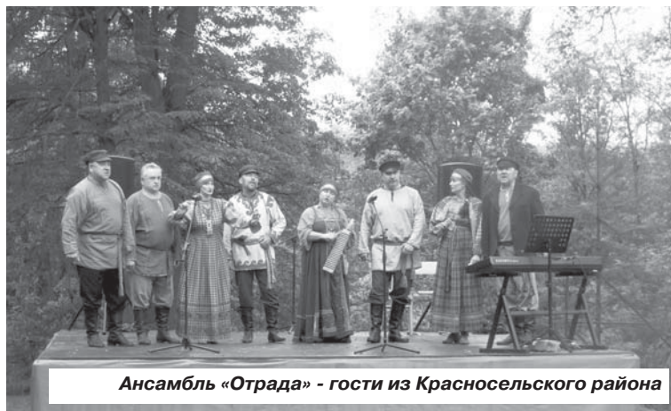
Ансамбль «Отрада» - гости из Красносельского района

Так что чудо произошло, дождь не испортил праздника. А еще одним долгожданным чудом стала отремонтированная, словно специально к этому событию, дорога до самого Василева. Теперь она блестит свежим асфальтом. Так что ехали с ветерком.