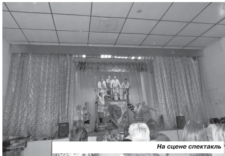
На сцене спектакль