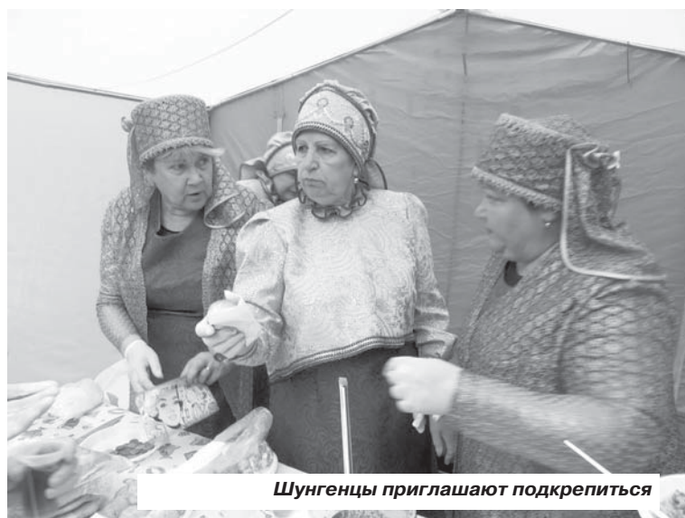
Шунгенцы приглашают подкрепиться