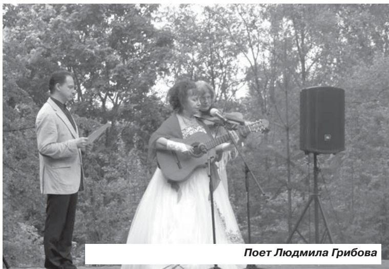
Поэт Людмила Грибова