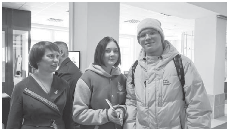
Волонтеры КФСХА поздравляют студентов с Днем молодого избирателя

дипломы от территориальной избирательной комиссии и сувениры, подготовленные избирательной комиссией Костромской области.