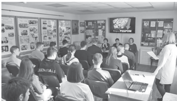
Ток-шоу «Вопрос ребром»

За круглым столом встретились будущие и молодые избиратели, их педагоги, настав-