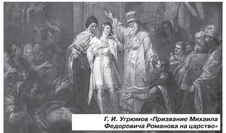
Г. И. Угрюмов «Призвание Михаила Федоровича Романова на царство»

27 марта костромичи молитвенно преклонятся перед чудотворной иконой Феодоровской Божией Матери.