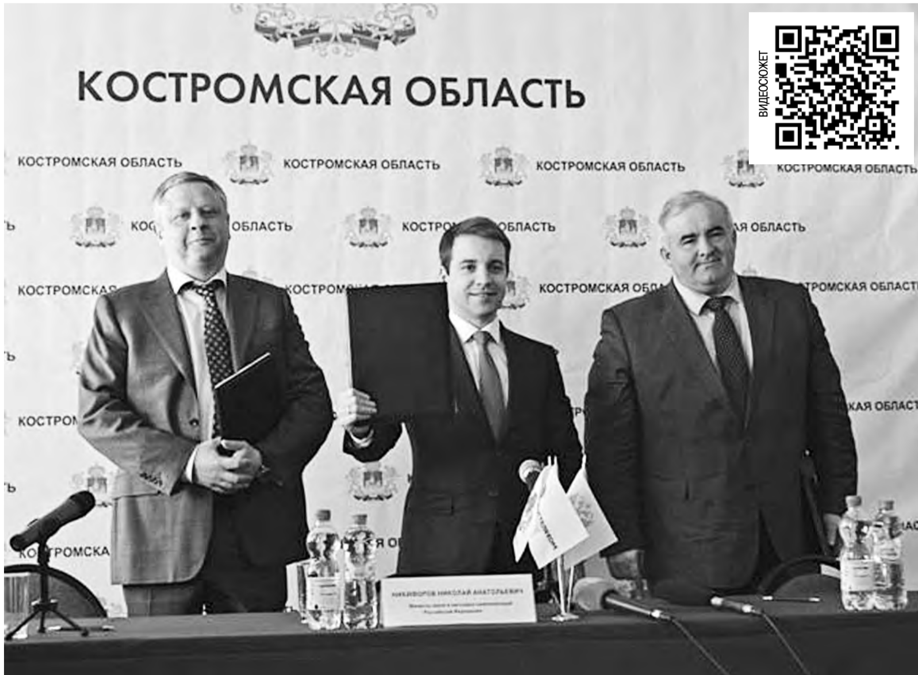
Подписано трехстороннее Соглашение о реализации пилотного проекта по обеспечению доступа к сети Интернет жителей малых населенных пунктов

«Вместе с Костромской областью мы демонстрируем пример эффективных инвестиций в условиях экономического замедления», - сказал глава ведомства. Он напомнил, что поправки в Федеральный закон о связи Президент РФ Владимир Путин подписал в феврале 2014 года. А спустя год оптоволоконную магистраль проложили по целому району Костромской области. «Именно такими темпами должна развиваться инфраструктура в нашей стране», - сообщил Николай Никифоров.