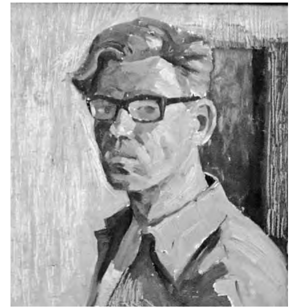
«Автопортрет» как автобиография: «твёрдое» лицо и непростая судьба