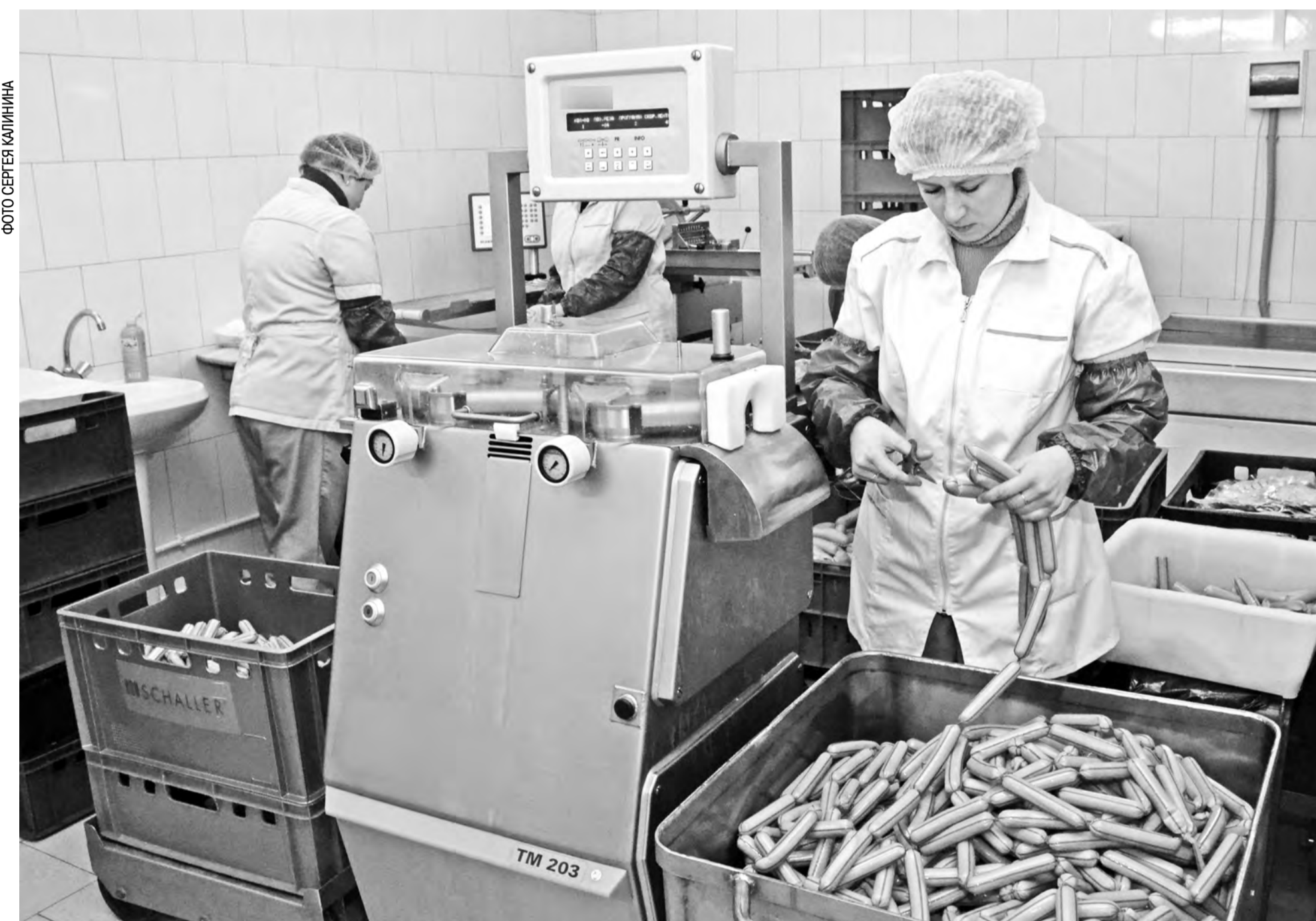
На поддержку сельхозкооперации в областном бюджете предусмотрено 58 миллионов рублей

Вопрос продовольственной безопасности остается в центре внимания администрации области. Меры, принимаемые по обеспечению социальных учреждений региона продукцией местных сельхозтоваропроизводителей, обсудили на еженедельном оперативном совещании при губернаторе. Главная задача - обеспечить учреждения соцсферы качественными местными продуктами питания даже в условиях, когда цены растут, а объем бюджетных денег остается прежним. С подробностями — корреспондент «СП-ДО» Юлия Меркурьева.