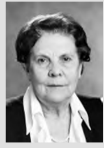
Галина ЗАДУМОВА, председатель комитета по труду, социальной политике и здравоохранению областной Думы:

Мероприятия должны быть направлены на поддержку эффективного бизнеса, социального бизнеса, того бизнеса, который платит налоги. Сейчас мы делаем акцент на импортозамещение, на меры, направленные на снижение роста цен. Наша задача сегодня - принять именно те решения, которые позволят наименее болезненно пережить те трудности, с которыми сталкивается как экономика, так и население области.