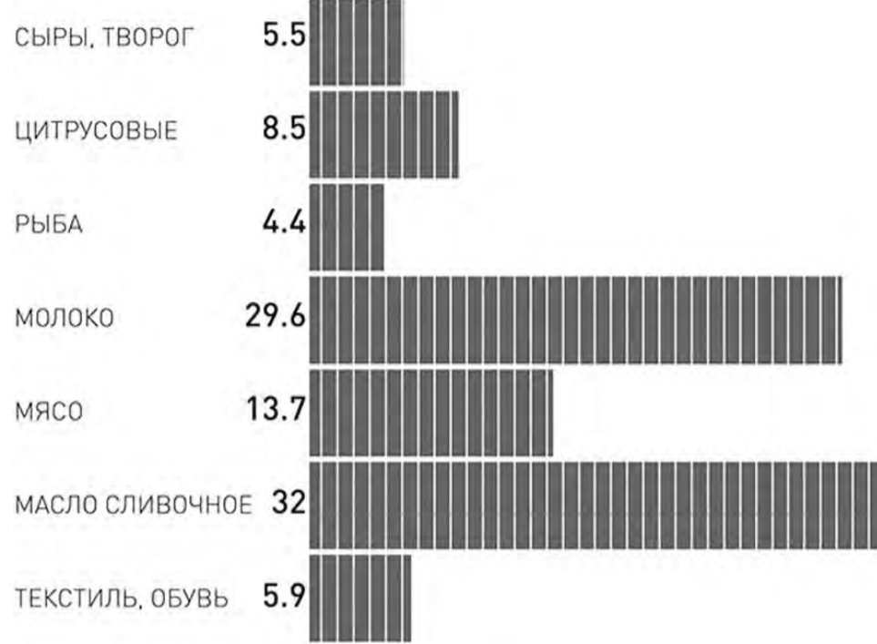
ДИНАМИКА ИМПОРТА В РОССИЮ Данные ФТС России за 2013 год

1,2-1,3 раза. Какой же из поставщиков победит?