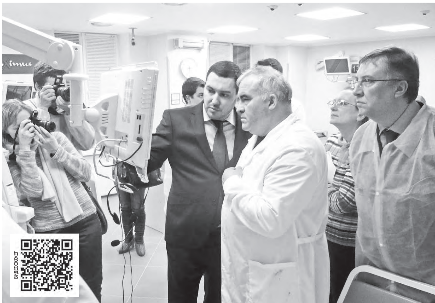
Нефрологический центр в Шарье губернатор Сергей Ситников назвал примером успешного государственно-частного партнёрства

В столице северо-востока на базе окружной больницы открылся нефрологический центр. Он создан в рамках государственно-частного партнерства. На открытии нефрологического центра и полностью реконструированного инфекционного отделения местной окружной больницы в ходе рабочей поездки на северо-восток региона побывал губернатор Сергей Ситников. Также он посетил строительную площадку, на которой ведется возведение Вохомского детского сада. В поездке губернатора сопровождал корреспондент «СП-ДО» Алексей ВОИНОВ.