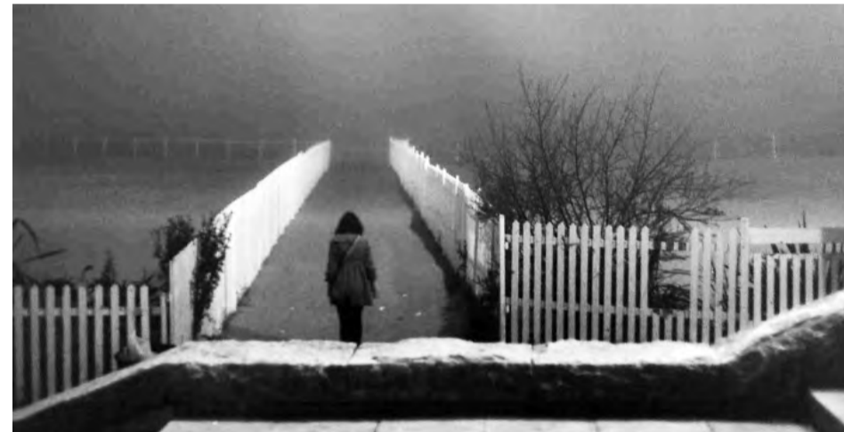
Для этих фотографий важна не функция объекта, а то, как он выглядит в данный момент