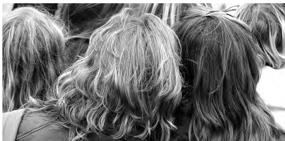
Фотограф обращает внимание на детали. Например, на прически в парижском стиле «только-с-постели»

тоды. Снимки он делал прямо на пленаре, во время этюдов в парке, где порой работал целый день, а вокруг него за это время менялись люди и события. Рядом всегда лежал фотоаппарат, и когда появлялось интересное — снимал. Заметил девушку в виде цапли, получилось фото «Цапля на Монмартре». Всем своим работам худож-