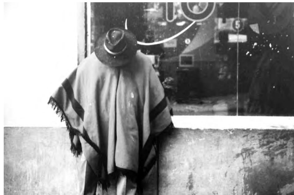
Стрит-фотография подразумевает внимание к таким вещам, которые люди в повседневной жизни не замечают