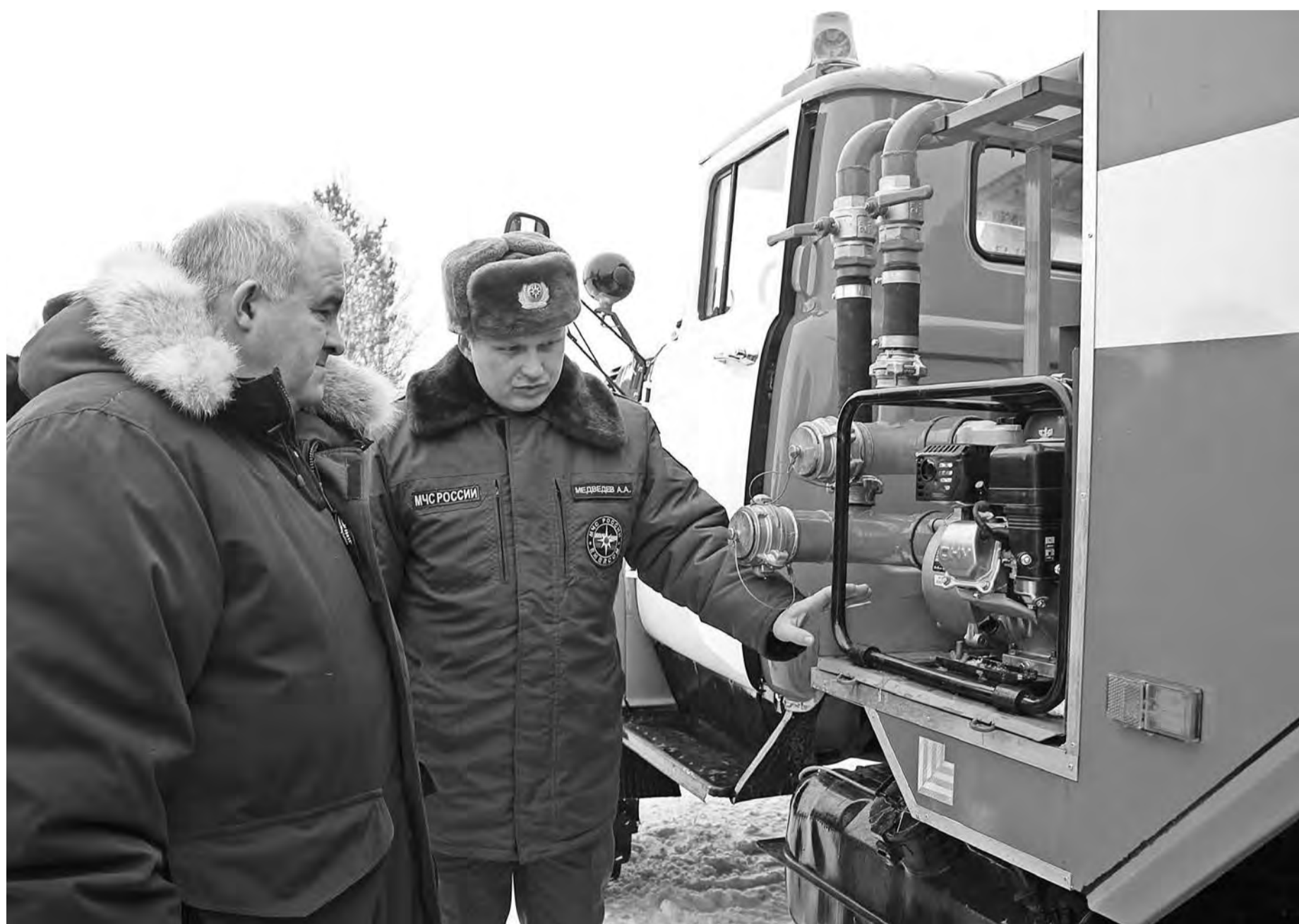
Через несколько минут пожарные расчеты заступят на боевое дежурство

В конце января в селе Соловецкое Октябрьского района сгорел деревянный дом, в котором проживала многодетная семья. Из десяти детей в ней восемь - приемные. На беду откликнулись многие костромичи. Всего за неделю в ящик для сбора средств в помощь пострадавшим, установленный в администрации области, поступило около пятидесяти тысяч рублей. Еще более тридцати тысяч костромичи перечислили на специальный счет. На следующий день после пожара в село Соловецкое из Костромы отправилась машина с теплой одеждой и предметами первой необходимости.