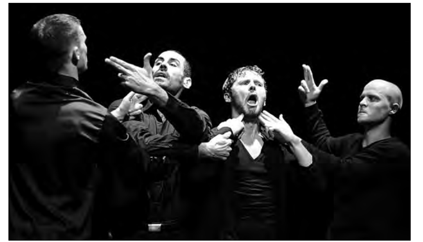
Если повезет, заветную «Маску» наш квартет получит на исторической сцене Большого театра

После костромской премьеры очень ироничный спектакль с откровенно брутальной энергетикой, рисующий картину жестоких жизненных игр мальчишек, повзрослевших только с виду, успел показать себя и на родине Маццотта и Шан-