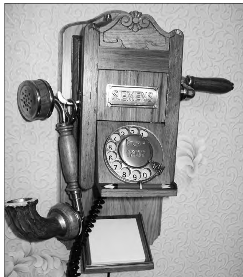
SIEMENS - сделано в Костроме

Поскольку дамы в разговоре не участвуют, о возрасте можно говорить без обиняков. Одному только-только исполнилось тридцать, другому недавно перевалило за пятьдесят. Окно одного выходит на Гостиный двор, у которого вечно толкутся извозчики, из окна другого открывается потрясающий вид на Льва Толстого. Одному, чтобы создать шедевр, двенадцать лет в самый раз, другому двух дней — с головой. 22 ноября в выставочном зале Костромского отделения Союза художников России корреспондент «СП-ДО» Дарья ШАНИНА оказалась на пороге двух миров: эстетствующего прошлого, покидающего зал, и жизнелюбивого настоящего, зал обживающего. И конечно, не удержалась: наведалась в каждый.