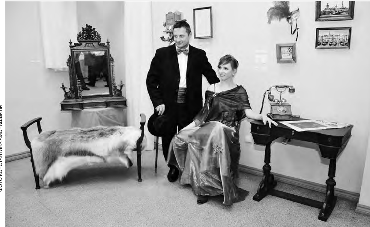
В пространстве выставки заседагатаи светских салонов XIX века чувствовали бы себя как дома

Насколько эклектичен Александр Эсе, настолько целен, органичен в своём мировосприятии Николай Афоньшин, чьи пленэры сегодня окончательно заступают на место эвевского ретро. За сутки до официального открытия «Моих пленэров», всматриваясь в каждую из привезённых и окончательно заступают на место эвевского ретро. За сутки до официального открытия «Моих пленэров», всматриваясь в каждую из привезённых и окончательно заступают на место эвевского ретро. За сутки до официального открытия «Моих пленэров», всматриваясь в каждую из привезённых и окончательно заступают на место эвевского ретро.