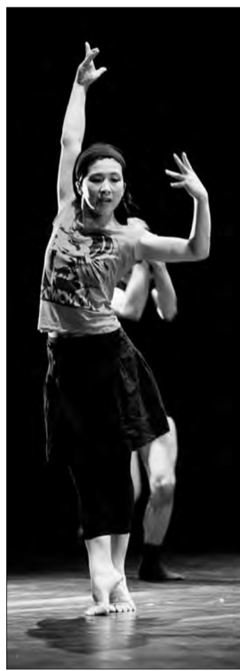
«Чай для двоих» T42 Dance Project, Швейцария

Вывод, однажды сделанный искусствоведами и теперь колючий притчей во языцех, к юбилейной «Диверсии» применен оказался на сто процентов: шутить на подмостках – не наш профиль. В смысле, русский арт во всех его проявлениях выражает национальную ментальность. А она, уж извините, в любые времена была одинакова: