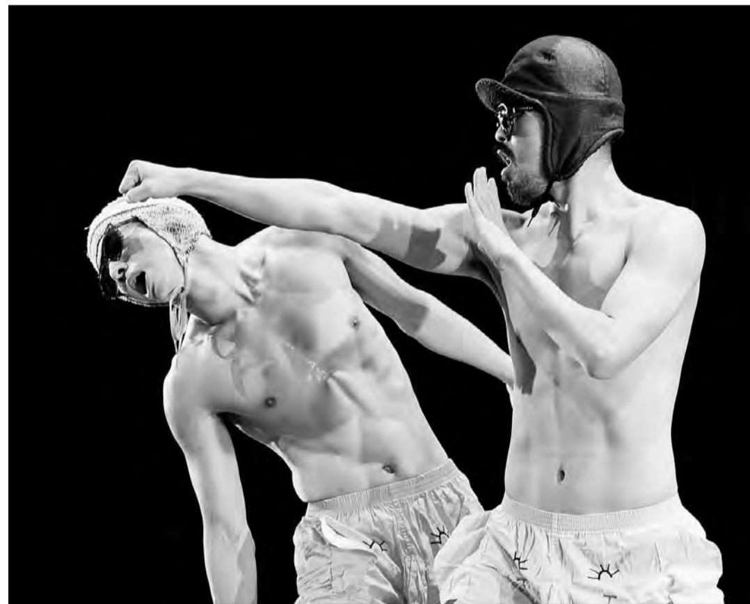
«Сосуществование». Ambiguous Dance Company, Южная Корея