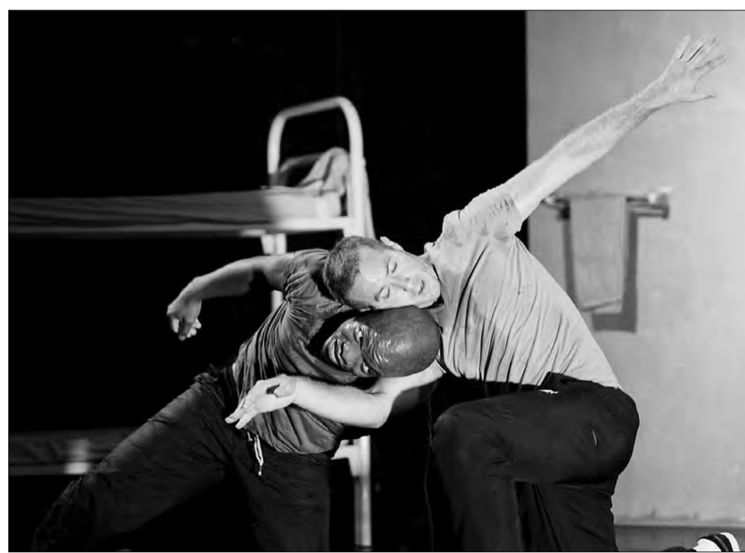
«Шёпоты». La Compagnie Malka, Франция