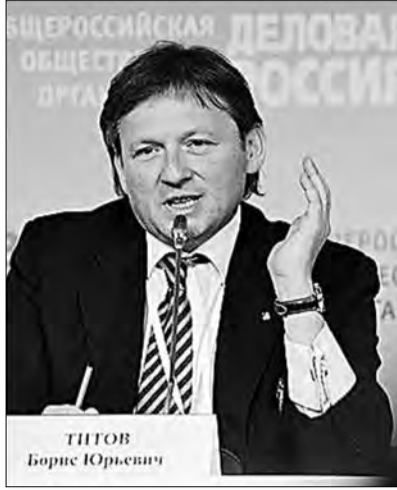
Борис Титов, председатель общероссийской общественной организации «Деловая Россия»

Отметим, что, говоря о господдержке каждого из двадцати пяти уже отобранных организацией пи-