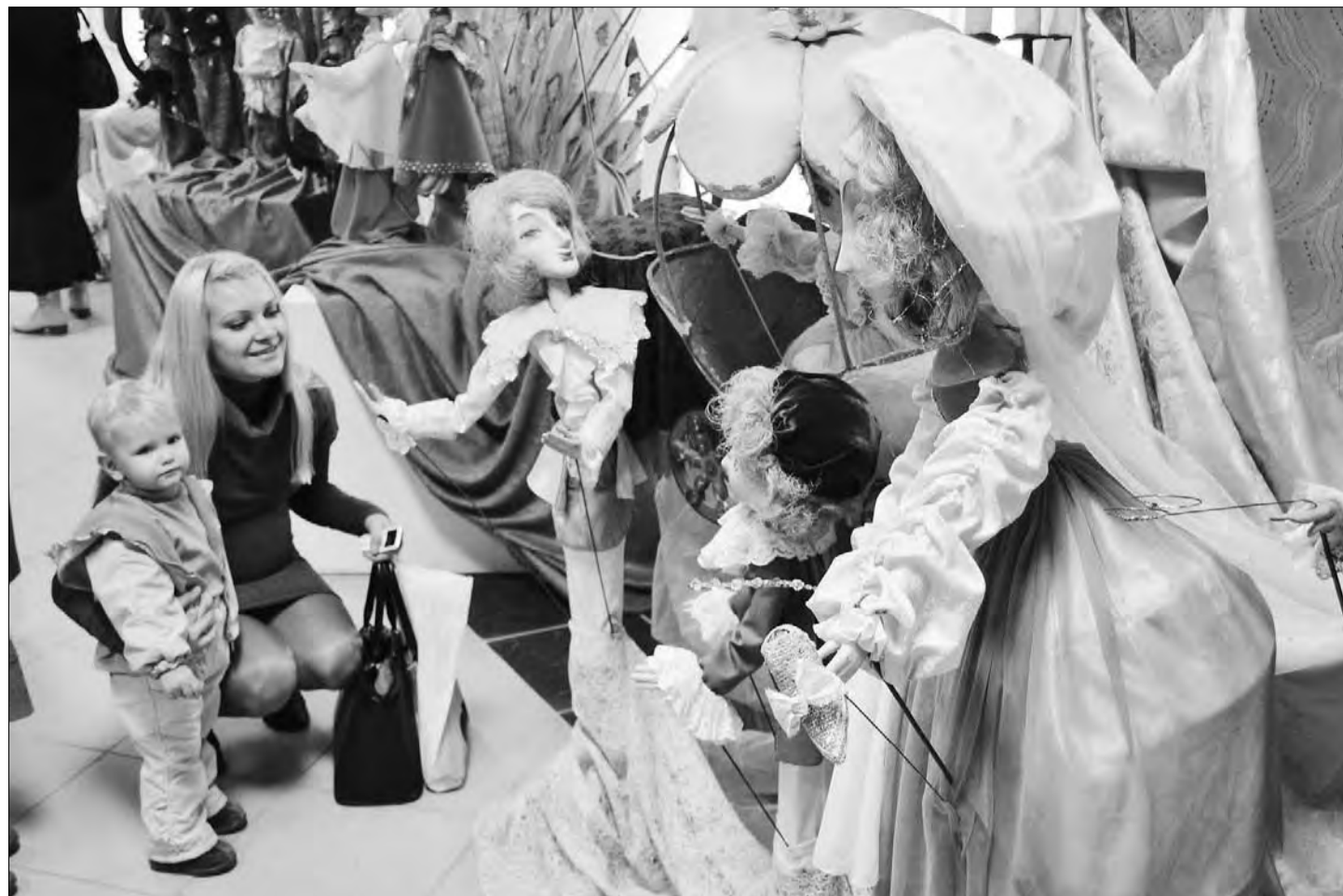
В галерее выставили 50 сказочных персонажей 75-летней истории театра

Здесь Золушка в кринолине и при высокой причёске, придворные в бархатных камзолах, мерцающие и поблещивающие друзья и враги «Аладдина», ярко размазанные, колоритные русские бабы, окружающие Крошечку-хаврошечку, пушкинские семь богаты-