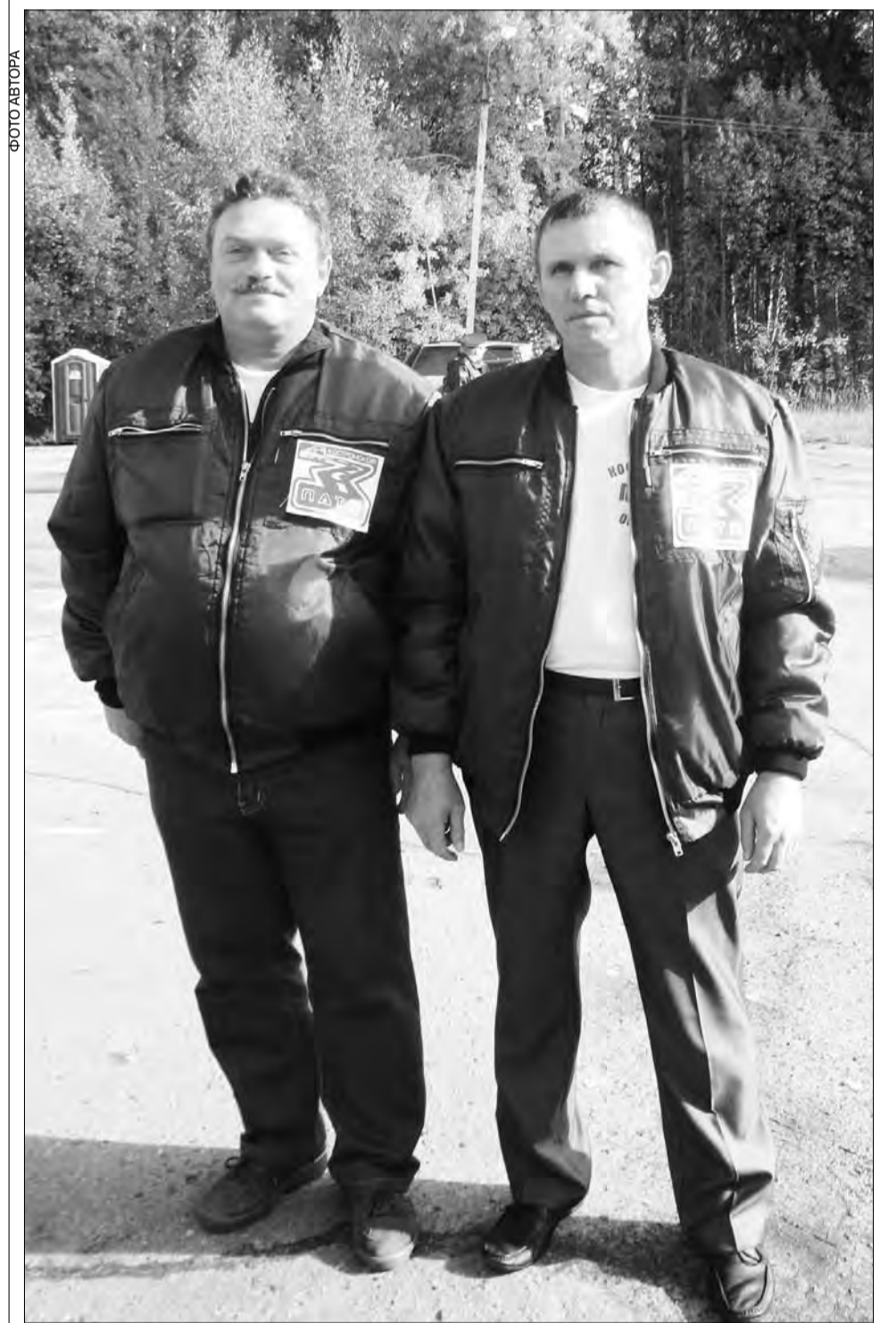
Команда №1 выиграла уже седьмую машину