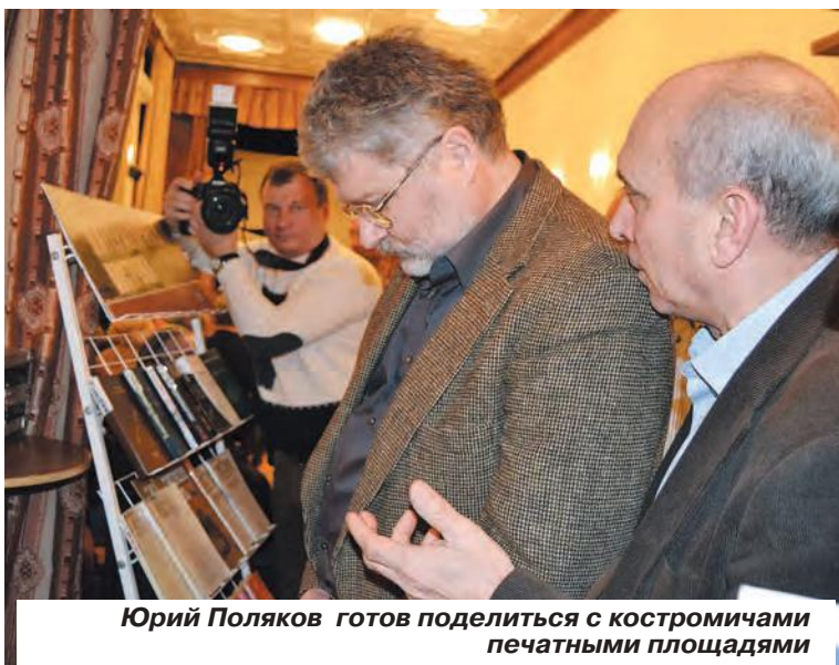
Юрий Поляков готов поделиться с костромичами печатными площадями

назад, совершенно чиста была бы журналистская совесть: в 2011-м первую столичную презентацию Литературной недели лучшие творческие коллективы нашей губернии превратили в настоящее шоу. Нынешнюю же однодневную оккупа-