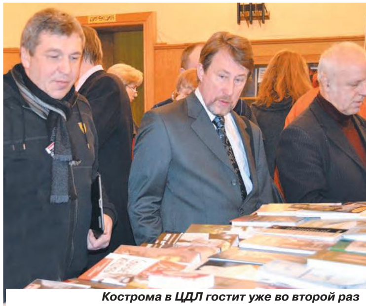
Кострома в ЦДЛ гостит уже во второй раз

цию костромичами главного писательского дома страны вернее было бы назвать конференцией: как-никак ради дискуссии на тему «Кострома в литературном процессе России» собрались в Малом зале ЦДЛ московские и провинциальные прозаики, поэты, библиотекари и журналисты. И хотя петь, понятное