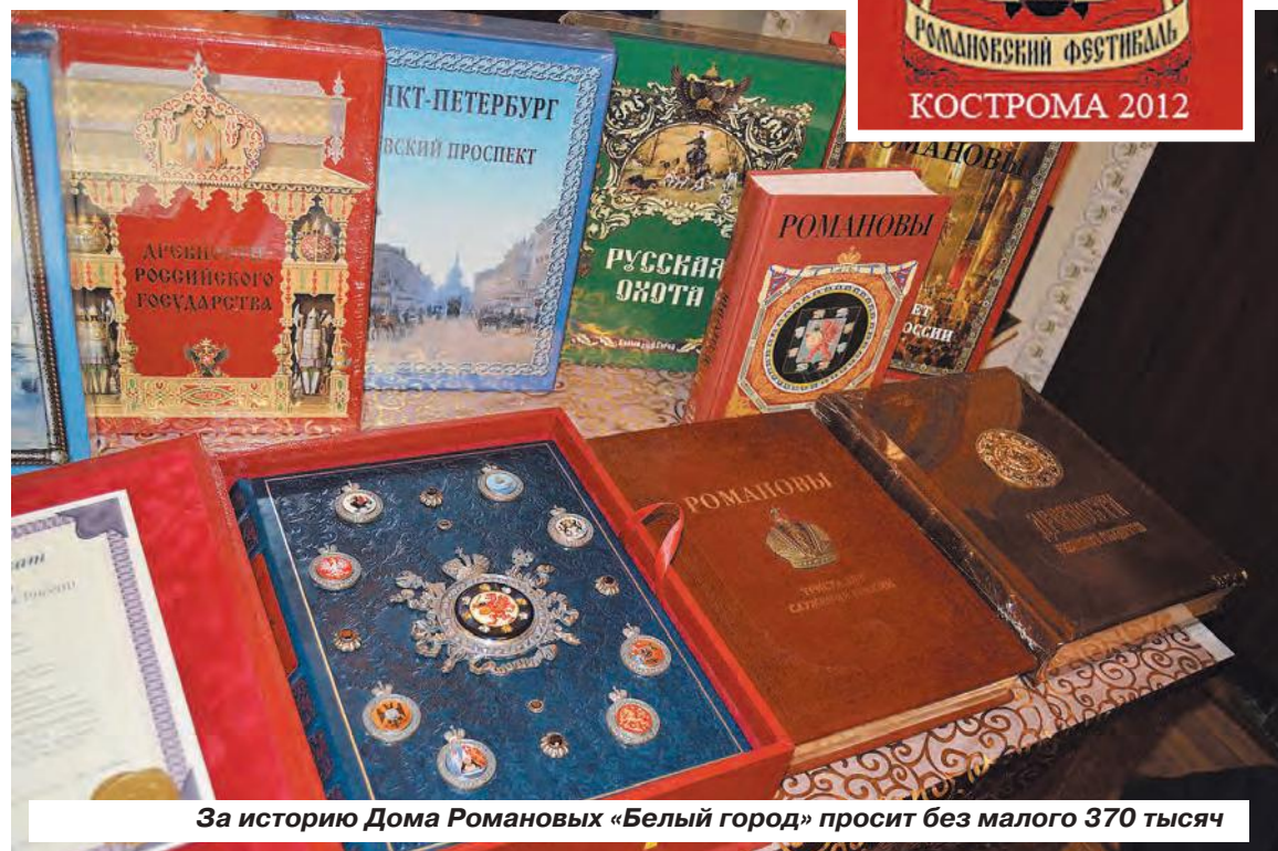
За историю Дома Романовых «Белый город» просит без малого 370 тысяч

дело, мало кто из выступающих был расположен, преподнести сюрприз тем искушенным столичным книголюбам, которые литературно-художественному вечеру памяти Пушкина предпочли трехчасовые дебаты, мы все-таки сумели.