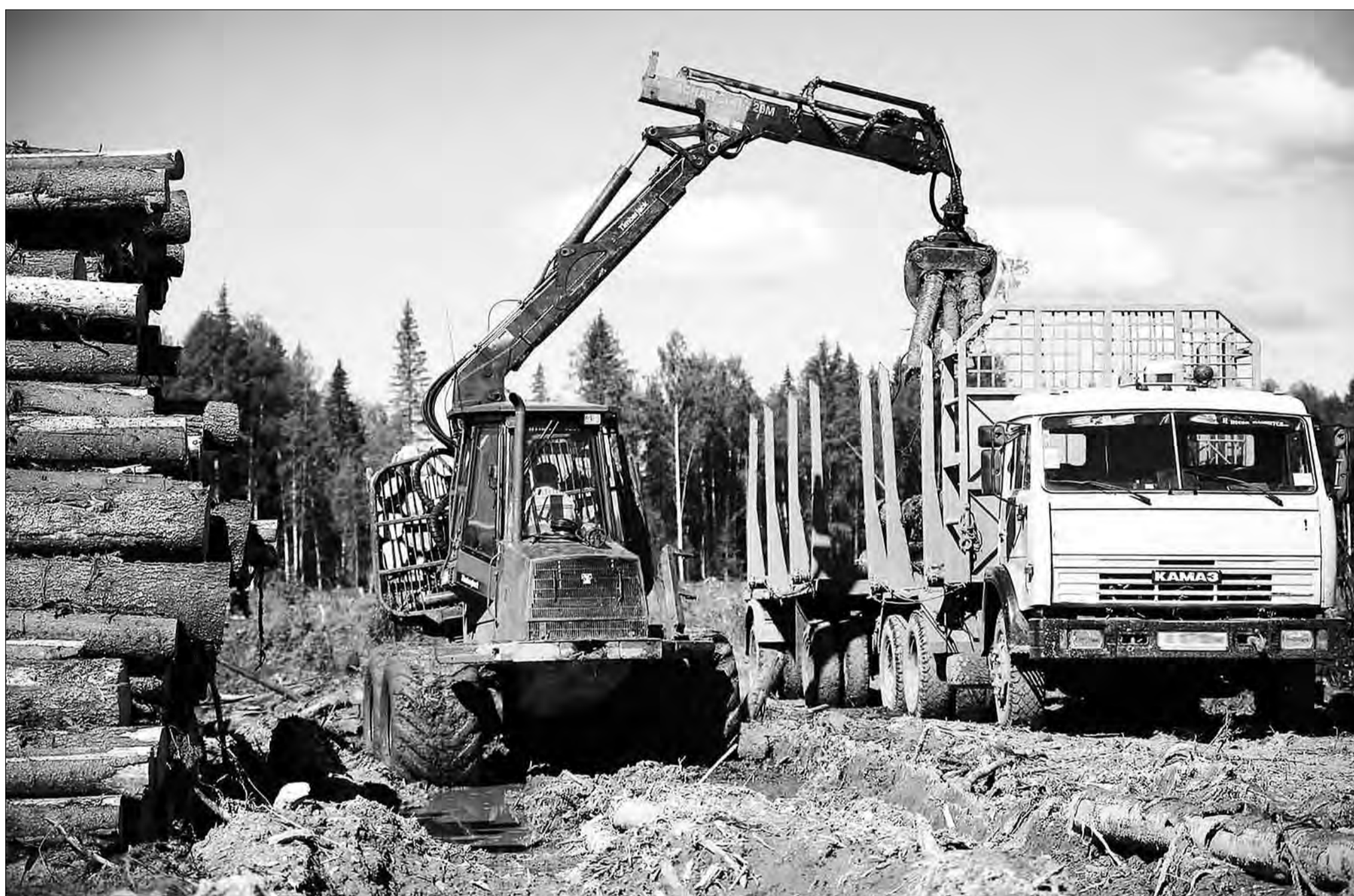
Около 90 процентов от общего объема инвестиций в ЛПК региона составляют вложения в обработку древесины и производство изделий из дерева.

Тотчас же кто-то предложил снять вопрос с повестки дня и ограничиться справкой для депутатов – какие инвесторы пришли, насколько эффективно они трудятся.